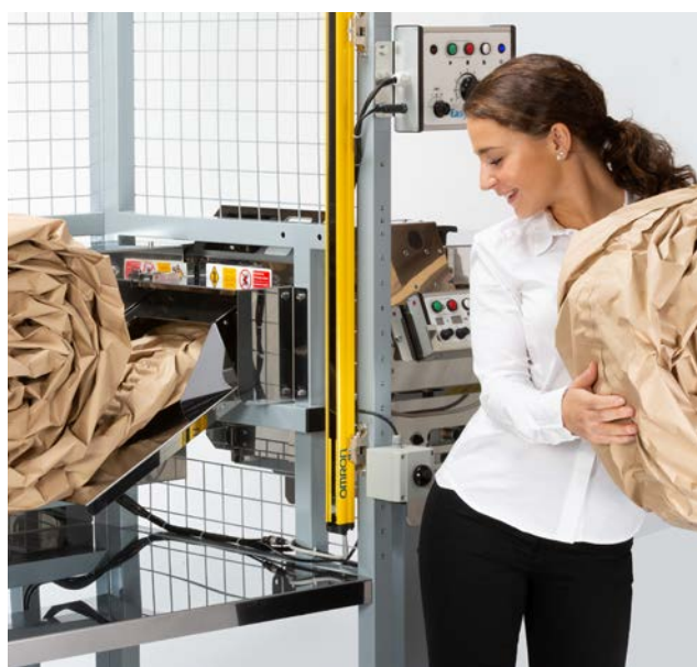
Fonction « Relance Automatique » mains libres pour une utilisation efficace et conviviale