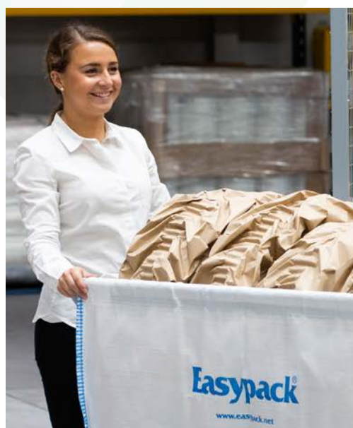
Emballer directement dans le colis ou transportez-le au point d'utilisation