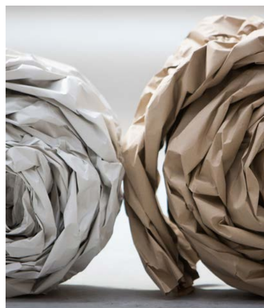
Le système convertit des rouleaux de papier simple ou double épaisseur, 100 % recyclé