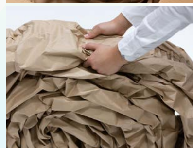
Bloquer l'extrémité libre sans avoir recours à un ruban adhésif

Quels que soient la forme ou le poids des objets à conditionner, le système Coiler vous permet de produire à la demande des coussins de qualité constante.