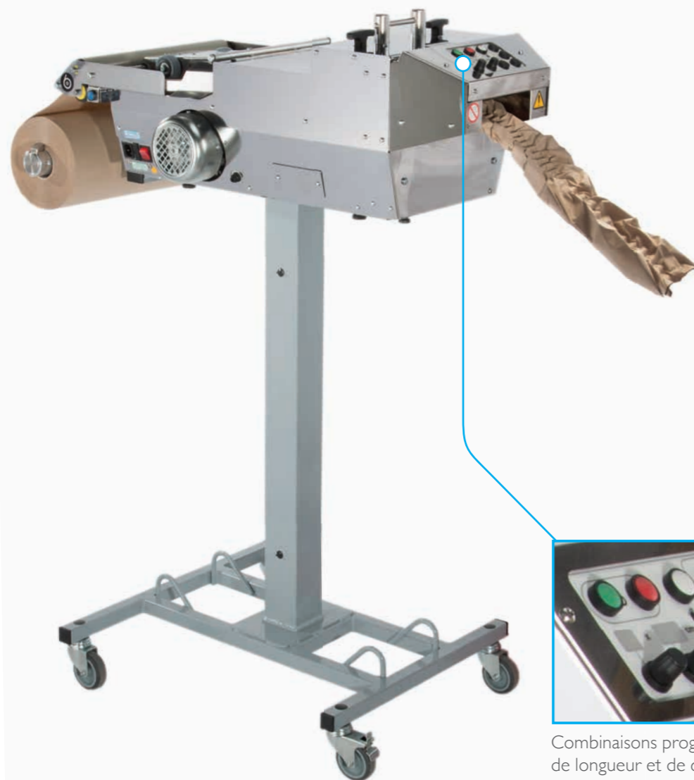
Combinaisons programmables de longueur et de quantité de bandes papier

Fabriqué au Royaume-Uni, le packmate™ pro fabrique des matelas de papier froissé légers et très résistants qui peuvent être facilement moulés autour de tout type de produit, offrant une efficacité de protection maximale.