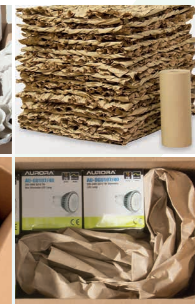
Chaque rouleau de papier produit jusqu'à 60 fois son volume d'origine, d'où un gain de place dans les entrepôts.

Le système compact est également léger et de faible encombrement pour s'intégrer dans n'importe quel poste de travail ou sur une table d'emballage. Le nouveau panneau de commande permet aux utilisateurs de pré-régler 3 longueurs de bandes papier différentes et de gérer la sortie du papier avec un nouveau système de pédale.