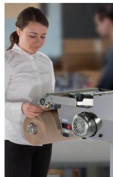
Packmate™ pro utilise 25% de papier de moins!