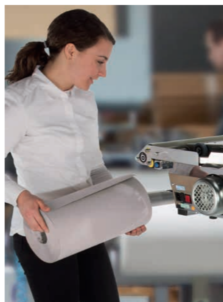
Convertit des rouleaux de papier 100% recyclé de simple ou double plis.